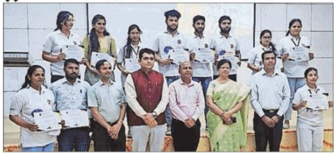
मस्तिष्क जागरूकता सप्ताह के समापन सत्र के दौरान उपस्थित शिक्षक व विजेता प्रतिभागी। (मोहन)

तत्पश्चात, ग्रिफिथ विश्वविद्यालय, ऑस्ट्रेलिया के डॉ. देवेंद्र अरोड़ा ने प्रतिभागियों